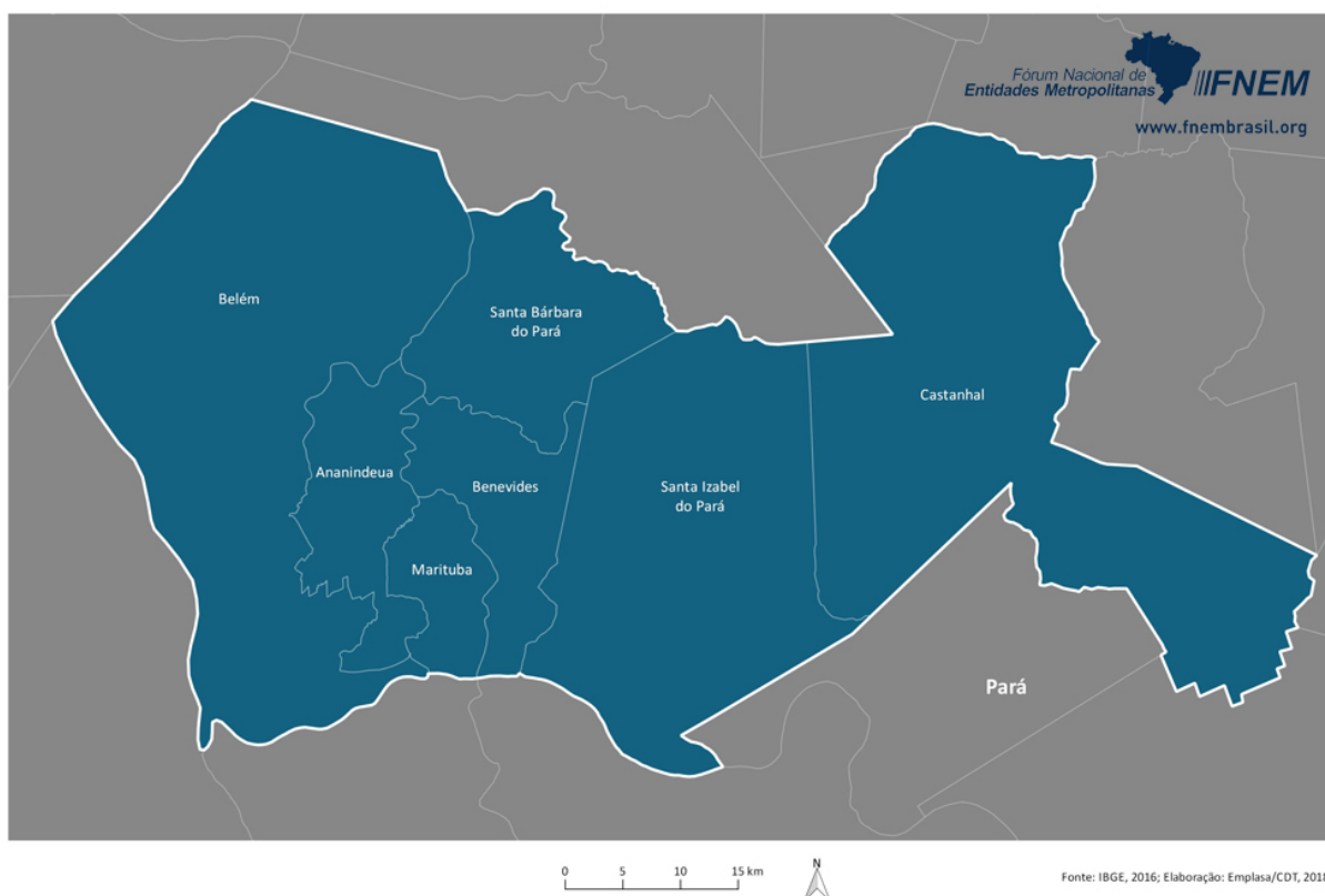
Região Metropolitana de Belém