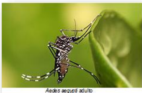
Aedes aegypti adulto

O Aedes aegypti é um mosquito que se encontra ativo e pica durante o dia, tendo como vítima preferencial, o ser humano, e não faz praticamente som audível antes de picar. Mede menos de 1 centímetro e é preto com manchas brancas no corpo e nas pernas.